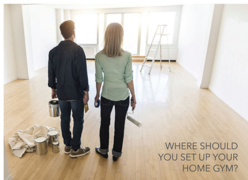
WHERE SHOULD YOU SET UP YOUR HOME GYM?

Jika Anda ingin merancang gym di rumah dengan peralatan gym di rumah modern yang bergaya, ditata dengan baik, dan memiliki beberapa peralatan olahraga paling canggih dan bergaya di dunia, maka kami dapat membantu Anda dalam 3 langkah mudah: Rencanakan, Rancang, Realisasikan. Kami telah menginstalasi sejumlah besar