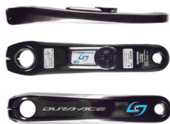
STAGES POWER METER

Seperti semua power meter Stages, unit Dura-Ace dan Ultegra ini dibuat dan dikalibrasi secara individual di Boulder, Colorado dengan standar kinerja, akurasi, dan keandalan yang tinggi. Semua power meter Stages di atas memiliki konektivitas bluetooth dan ANT+ , daya tahan baterai 200 jam, dan akurasi tinggi.